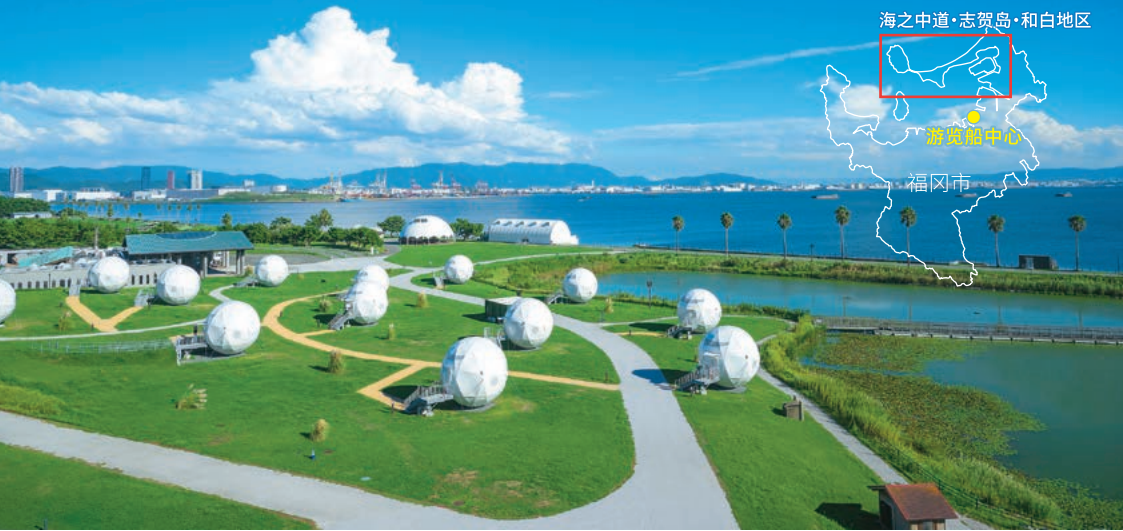
海之中道·志贺岛·和白地区